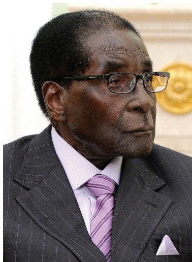
2. Robert Gabriel Mugabe (ur. 21.02.1924 – zm. 6.09.2019).