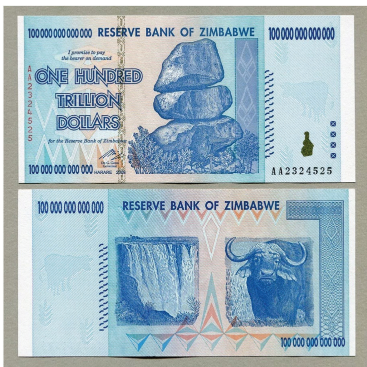
3. Najwyższy nominał na świecie: sto bilionów dolarów zimbabweńskich.